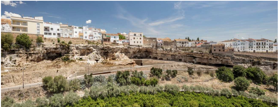
Casas Colgantes de Caño de Hierro_ Vista desde Cuevas de las Carretas y Fuente de Caño de Hierro

La inversión total, realizada por el Ayuntamiento de Hornachuelos, fue de 224.988,46 Euros. El inicio de las obras fue en junio de 2018 culminándose en marzo de 2019.