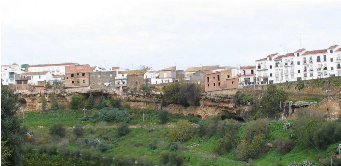
Zona de Casas Colgantes de Paraje de Caño de Hierro_ Imagen tomada antes de la limpieza y desbroce de la zona (diciembre,2016)

La inversión fue realizada por el Ayuntamiento de Hornachuelos y la actuación tuvo lugar durante aproximadamente 2 meses con un coste de unos 25.500 Euros. La fecha de su ejecución fue durante el primer trimestre de 2017.