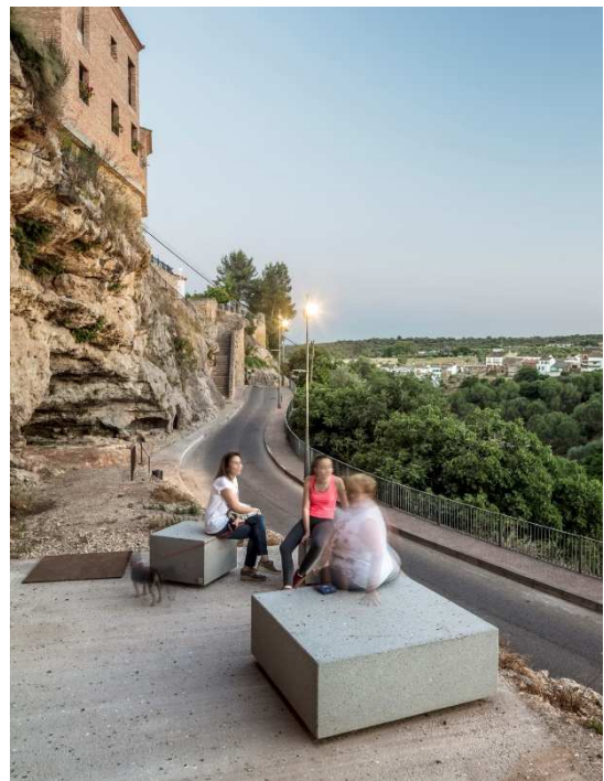
Imágenes de la intervención bajo Casas Colgantes