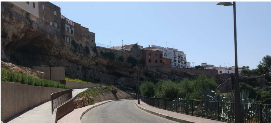
Casas Colgantes de Paraje de Caño de Hierro_ Alumbrado público actual (LED)