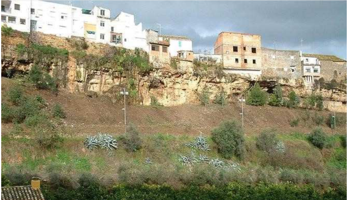
Zona de Casas Colgantes de Paraje de Caño de Hierro_ Imagen tomada después de la limpieza y desbroce de la zona, antes del desmonte de tierras (enero, 2017)

Plaza de la Constitución, nº 1 – C.P. 14.740