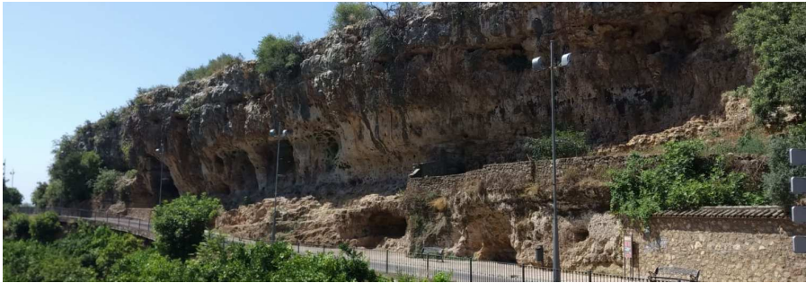
Zona de Cuevas de las Carretas en Paraje de Caño de Hierro_ Alumbrado público actual (LED)

reembolsable a interés 0 al IDAE, por valor de 300.000 Eur para la sustitución de alumbrado público de numerosas zonas del núcleo. Una de las zonas, dentro de las que se trabajó en la sustitución de puntos de luz fue Caño de Hierro. La inversión en esta zona supuso el 10% de la inversión total, es decir, 30.000 Euros aproximadamente para 90 puntos de luz y el cuadro eléctrico tele-gestionado. Para mejorar la eficiencia energética de la instalación se utilizaron diferentes medidas: empleo de sistemas de reducción de flujo luminoso en horarios de poco tránsito, fuentes de alimentación de alta eficiencia y empleo de luminarias con rendimiento superior a 110 lm/W. Por otro lado, para paliar la contaminación lumínica se adoptaron medidas como el empleo de proyectores “spot light” para reducir flujos intrusos. A finales de 2018, la sustitución del alumbrado público en la zona era una realidad. Esto sumó un valor añadido importante a la serie de actuaciones encaminadas a la puesta en valor de la zona. Gracias a una correcta y más equilibrada iluminación, se empezó a poder pasear sin problema de forma más segura y en cualquier momento del año a cualquier hora nocturna.