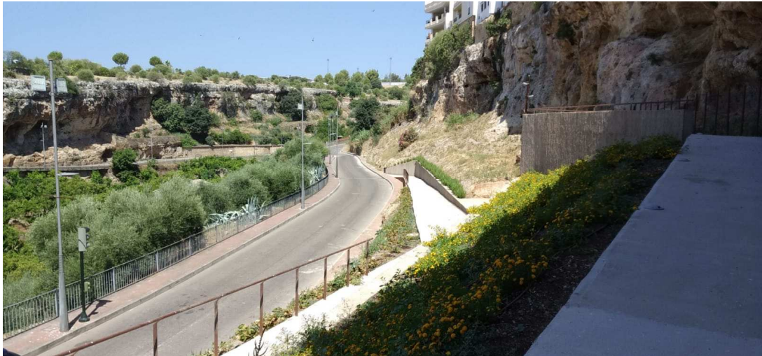
Vista desde área de Casas Colgantes hacia Cuevas de las Carretas

Plaza de la Constitución, nº 1 – C.P. 14.740